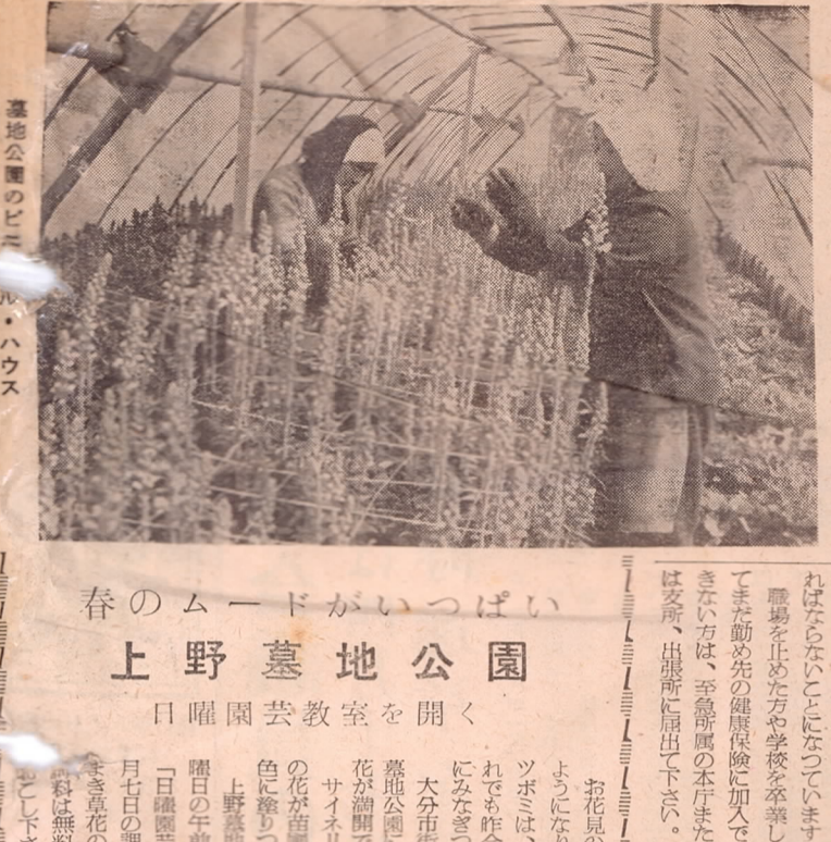
第15回婦人週間大分地方婦人会議

⑦赤やんが生まれたとき： 赤やんが生まれたときは、助産費として二千元、赤やんを育てるための育児手当金一千二百円をさしあげます。なおこの育児手当金は合併まではまちまちでしたが、四月一日以後は全市ど同じように取り扱われます。 ⑧赤やんが生まれたとき： 赤やんが生まれたときは、助産費として二千元、赤やんを育てるための育児手当金一千二百円をさしあげます。なおこの育児手当金は合併まではまちまちでしたが、四月一日以後は全市ど同じように取り扱われます。 ⑨赤やんが生まれたとき： 赤やんが生まれたときは、助産費として二千元、赤やんを育てるための育児手当金一千二百円をさしあげます。なおこの育児手当金は合併まではまちまちでしたが、四月一日以後は全市ど同じように取り扱われます。