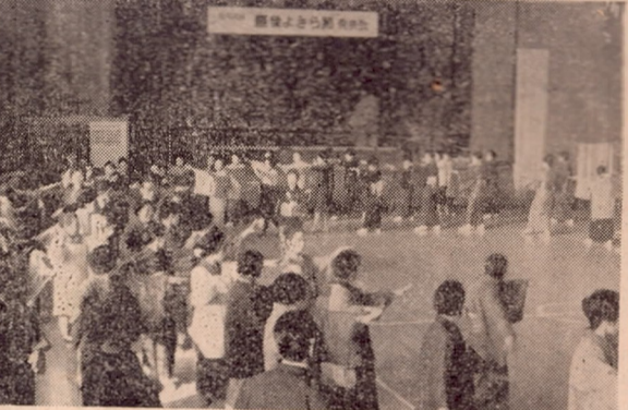
豊後よさら節発表会

やむを得ず給水を停止いたしましたので停水通知を受けたいよう、今までの給水の滞りがある方は水道課に連絡の上、早急に納入下さるようお願いいたします。