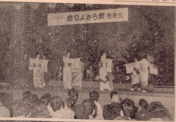
豊後よさら節発表会