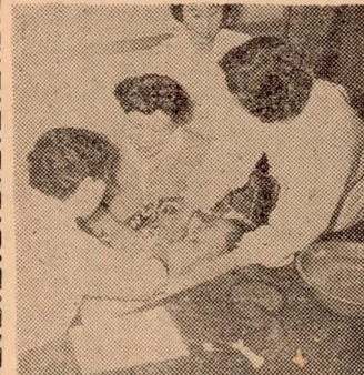
写真説明【左】 医師による健康診断 【下】 乳児の離乳 人工栄養指導

大分保健所と大分市医師会の協力 親となり父親となる様努力された により、モテル母子保健都市大分 市をめぐり十月より発足した母 子保健衛生の組織活動はたいへん よき成績で、市民の方々から喜ば れ発足の十月は乳児二〇〇名、妊 婦五〇名が受診されました。又二、実施事項 の診断に当り貴重な時間をさかれ て無料奉仕される医師会の先生方 へは、何と御礼を申し上げてよいか 深く感謝致して居ります。