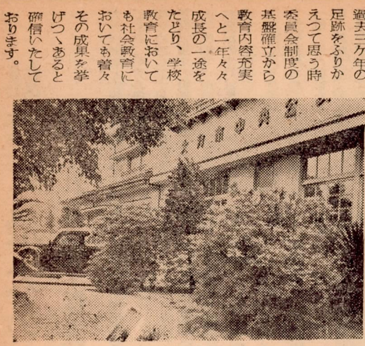
大分市教育委員会正面

恒例の大分市文化功労者の表彰式は、十一月三日(文化の日)日没後、市議會議事堂で行われます。表彰される人は前以つて各方面から御推薦をいただいた方々について、市長が市の文化功労者表彰審議会にはかり慎重審議の上次の個人十、一氏と一団体がまりました。当日は午前十時に式が始まり市長から表彰状と記念品が贈られます。尚表彰される方々は次の通り(順序不同)