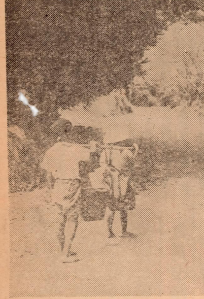
山道を行くトウフ賣り兄妹

山道を行くトウフ賣り兄妹。この兄妹二人は、昨八月に大分市八幡寺山の元木職を尋ねては売り歩いていた。... (Text continues with the tofu sellers' story)