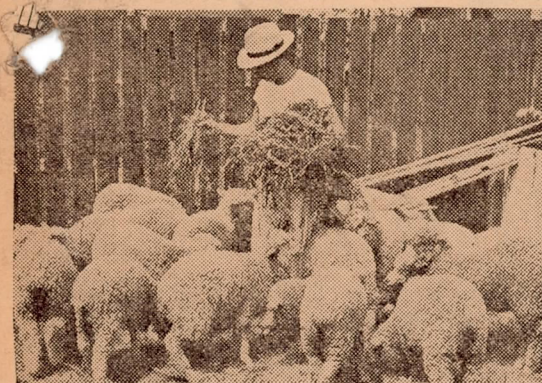
鶏の最産卵期になるから、栄養に充分気をつけること。栄養が不足すれば産卵が早く来て夏から秋にかけて産卵が少なくなり、又色々な病気がかかり易くなるので飼料の配合に注意して一羽当りの可消化蛋白質を少くなくとも六割は与えて下さい。(農務課の種田技師)

苗代、麦刈、田植と農繁期に入ると兎角家畜の手入は留守勝となり加えて梅雨期ともなれば畜舎は不潔となつて家畜の健康状態は悪くなる。しかも飼料は腐敗し易く、はえやかの発生に伴い各種の病気を誘発して思ひがけぬ損失を招くので、次の事項に留意して家畜の健康保持に努めて下さい。 一、畜舎及び器具の消毒 畜舎の通風を図ると共に畜舎及び周囲の排水を良くして、敷草は常に新鮮なものと取替へ、はえやかを駆除して環境を良くしてやることか大切です。尚腐つ た飼料を与えぬ様、器具は清潔にして下さい。特に乳牛飼育者は乳室や器具は完全に消毒し、手を清潔にして牛乳の取扱に注意し冷却を充分にして戴きたい。 二、綿羊、山羊の腰まひ症予防 腰まひ症はかかぬから、かの発生場所をなくすると共にDDTを撒布してかを駆除すること。 尚予防薬に注射、内服薬の二種があり、之を二〇日毎に確実に投薬すれば予防が出来る。 三、鶏の管理