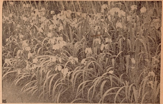
上野市営苗圃のアヤメ