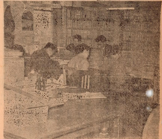
(大分市選挙管理事務局)

一月末日納期の固定資産税第四期最後の市税でありますので、是非日迄の間に納税者の御手許に配付されておきます。この固定資産税第四期分を納期内に完納された方には、抽せんにより沢山の賞金を差し上げる事になって居ります。賞金の総額は拾五万円でくじに当たる率は従来のくじよりも非常によくなっています。尚この税金は昭和二十九年度中の