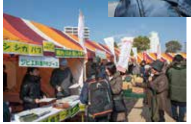
ジビエ料理のPRブースの様子