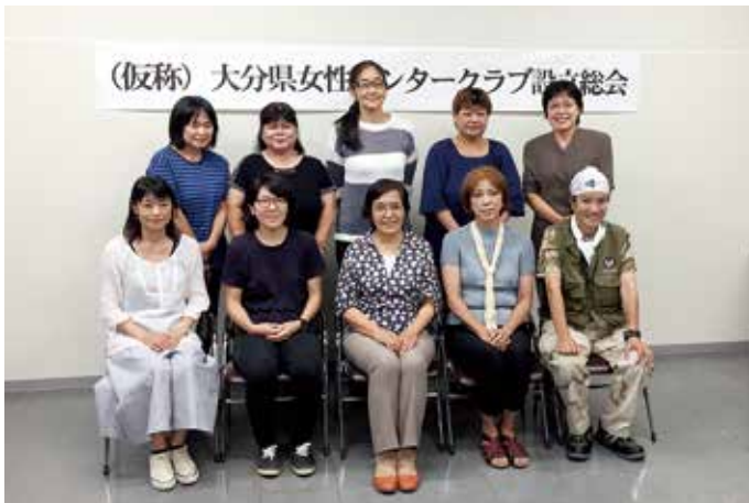
女性猟師たちによる新組織「大分レディースハンタークラブ」発足時の写真。今後は、定期的な情報交換のための“女子会”を開いて、ジビエの活用策を考えていく。

だから、そのためには、被害の原因となることを解決していかねばならないと思います。つまり動物たちが人の生活圏に下りてくる原因を除去することですね。例えば、生ごみは決まった時間に出す、畑には防護柵を設置するなど。人間と動物が共存できるようにするためにも、まずはわたしたちができることからやらなければいけないと思います。