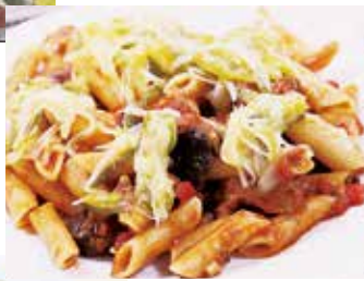
ペンネアラピアータ