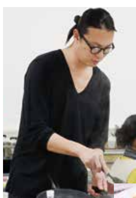
講師は、出張料理人の(食)ソウダルアさん

調理の仕方では味が変化するジビエ 最初の実験は、「高温と低温で肉の味にどう変化が出るのか」。その結果、高温に熱せられたフライパンで肉をさっと焼くと、しっかりとした歯ごたえに。反対に低温でじっくり焼くと、やわらかく、ふんわりとした食感になりました。