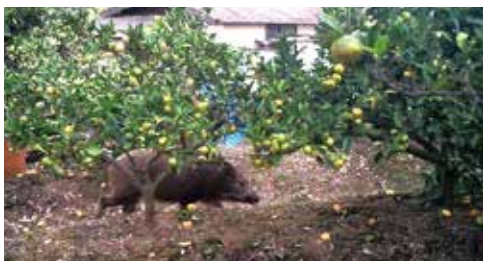
一尺屋地区のミカン畑に現れたイノシシ