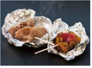
左がイノシシ肉のお茶しゃぶ、右がシカ肉のシカバブ

「味に癖がありそう」「肉が硬そう」などネガティブな意見が多くありましたが、しかし実際に試食してみると、「全然臭みがない!」や「味が牛肉や豚肉に似てる」など、ジビエに対するイメージが変わったよう。子どもたちにもジビエは人気。初めてのジビエに「おいしい!」と顔をほころばせていました。中にはおかわり希望の子も…。