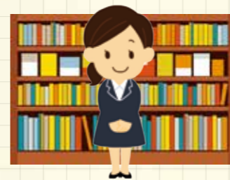
☎ 市民図書館 ☎576-8241