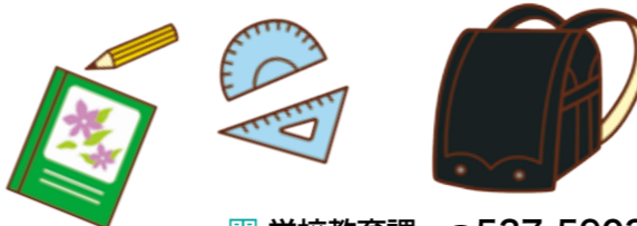
☎ 学校教育課 ☎537-5903

定員、条件、申請方法など詳しくは、学校教育課(第2庁舎4階)または各学校に備え付けの「大分市小規模特認校制度のご案内」、市ホームページをご覧ください。なお、新1年生は1月下旬に入学通知書が届いてから申請してください。