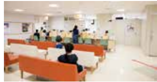
大分市パスポートセンター