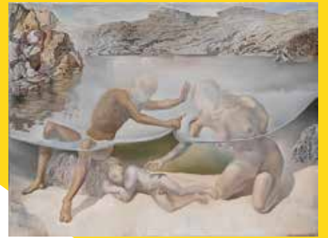
海の皮膚を引き上げるヘラクレスがクビドをめざめさせようとするヴィーナスにも少し待って欲しいと頼む 1963年 長崎県美術館蔵 © Salvador Dalí, Fundació Gala-Salvador Dalí, IASPAR Tokyo, 2017 E2725

本展では、版画集「神曲」(ダンテ著)や「シュルレアリスムの思い出」など、初期から円熟期、そして晩年にいたる200点以上の版画作品をとおして、油彩だけではない、ダリの「もうひとつの顔」を紹介。また、長崎県美術館の油彩画を大分で特別展示します。