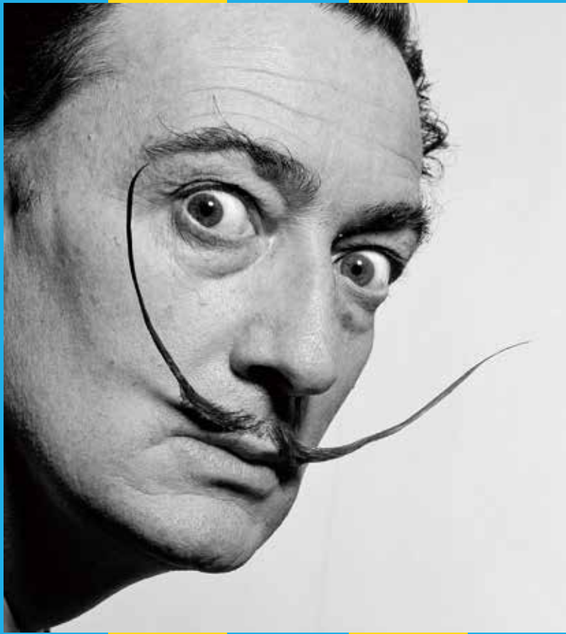
「Dalí's Mustache シリーズ」より