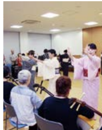
鶴崎おどり保存会による練習の様子

先人たちの苦勞があり今があるので、感謝の気持ち忘れずに、鶴崎踊の誇りを守っていきたい…その思いであふれていました。