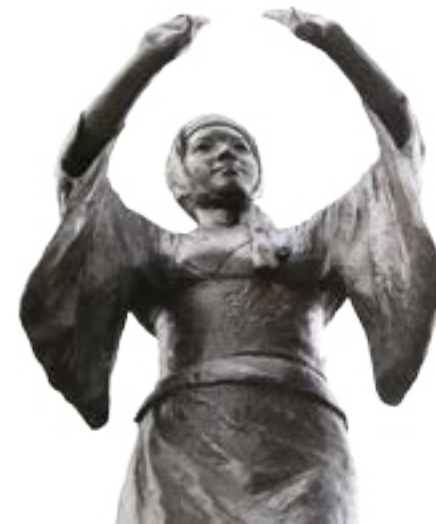
鶴崎踊のブロンズ像

鶴崎駅の前にある記念碑の青銅板に、鶴崎踊への思いがこめられた文章が刻まれています。その一部を抜粋してご紹介しましょう。 「盆が近づくと鶴崎の血が騒ぐ。暮なすむ夏の宵、踊り囃子の音が遠くから聞えてくる。湯上りの化粧に新しい踊衣装、もう鶴崎が踊り出すようだ。(以下省略)」 鶴崎踊が近づいたまちの熱気や、心おどる気持ちが手に取るように分かります。 450年以上もの長い年月、こうして絶えず現代までに伝えられてきた鶴崎踊。そこには、踊りの魅力をもっと多くの人に見て、知ってほしい、という保存会の熱い思いや取り組みによる「広げる力」、そして踊り手や歌い手が日々の練習を重ね、世代や地域を超えて伝統を伝えていく「つなげる力」がありました。そして何より、鶴崎地区の人々の「鶴崎踊を誇りに思う心」があったからこそ、長く踊り継がれてきたのです。 今年の「本場鶴崎踊大会」は8月19日(土)・20日(日)に開催します。華やかな踊り手が七重八重の輪になって踊る美しい光景を、ぜひ会場でご覧ください。