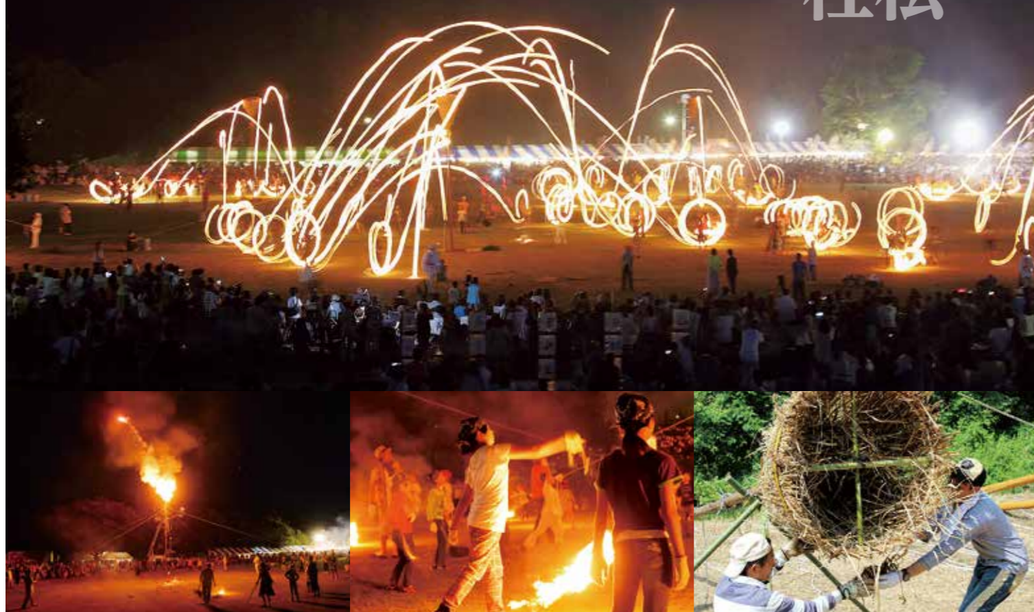
※市報7月15日号で火群まつりのスケジュールをお知らせします。

アシや花火などで作られた束を柱の先端に取り付けた「柱松」に、火のついた松明を投げ入れ、先端が燃え、花火が上がるまでの時間を競う。優勝チームには「真紅の優勝半纏」が贈られ、翌年の柱松には、チーム代表者が半纏を着て入場する。