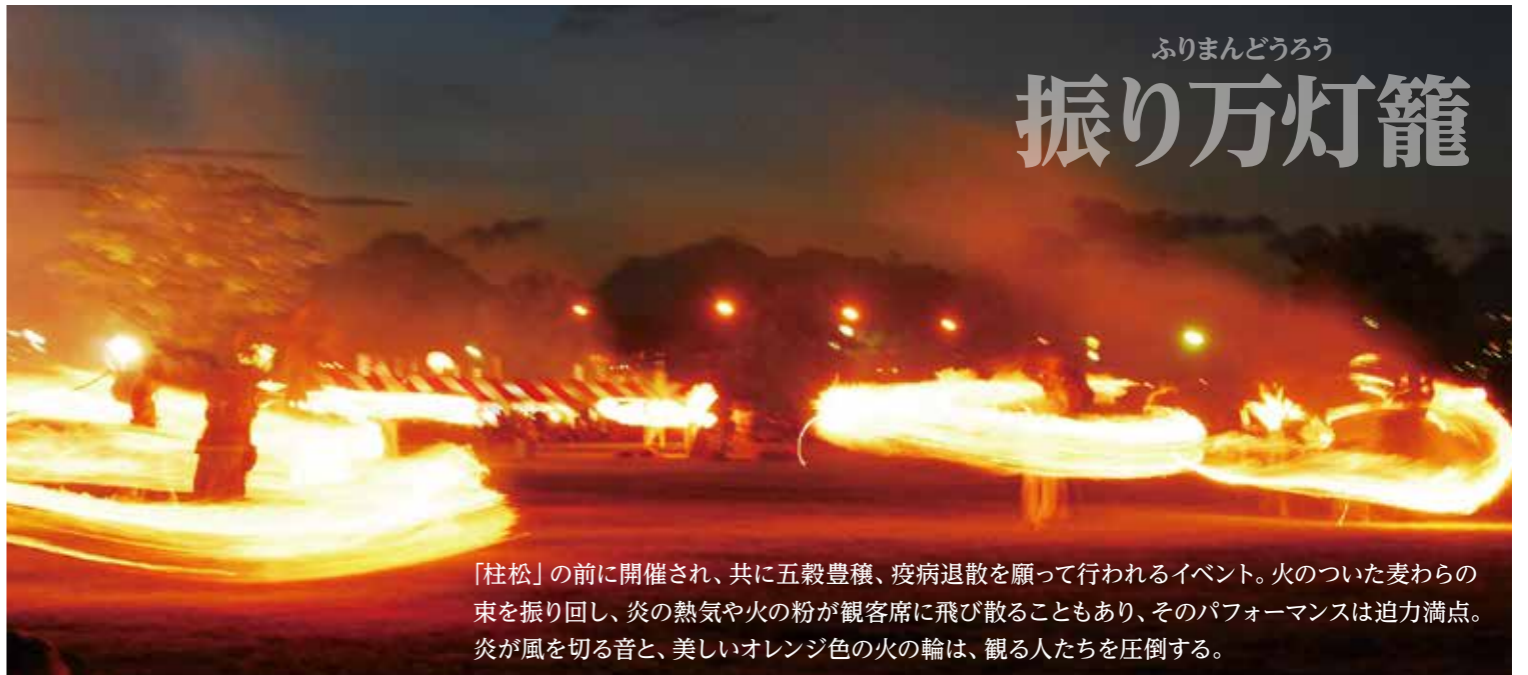
「柱松」の前に開催され、共に五穀豊穡、疫病退散を願って行われるイベント。火のついた麦わらの束を振り回し、炎の熱気や火の粉が観客席に飛び散ることもあり、そのパフォーマンスは迫力満点。炎が風を切る音と、美しいオレンジ色の火の輪は、観る人たちを圧倒する。