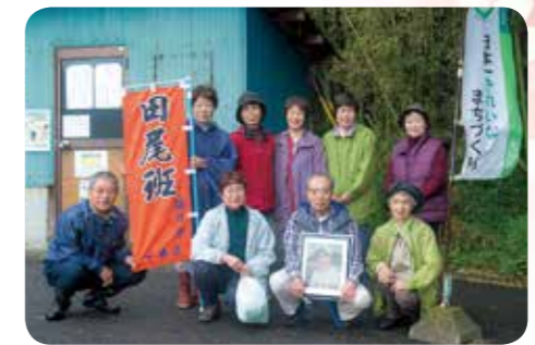
大分市一木区田尾班一同 (一木)

永年にわたり、地区内における道路周辺の清掃活動に献身的に取り組み快適で住みよい地域社会づくりに貢献されました。