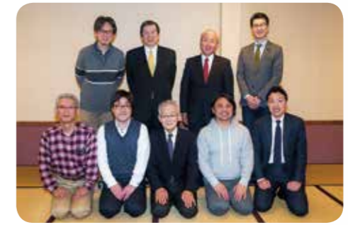
大分都心まちづくり委員会 (中央町)

永年にわたり、地区内における道路周辺の清掃活動に献身的に取り組み快適で住みよい地域社会づくりに貢献されました。