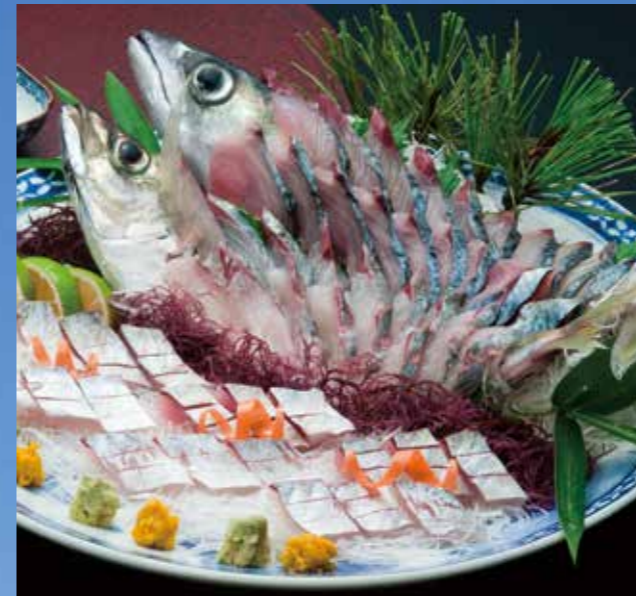
関さばは12～3月、関あじは7～8月が旬。イサキやタイ、ブリなど、佐賀関で獲れる関ブランドは他にもあり、漁法、出荷方法は関あじ関さばと同じ。

昭和63年、魚価が下がる中で組合員の所得を上げたいと、漁協が漁師から魚を買い取る仲買業務を開始しました。買い取った魚をどうやって売るのが？その課題に漁協、行政がタッグを組んで挑み、東京を始めとした都市部でのキャンペーンを行い