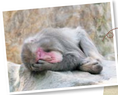
おじいちゃんザルはよくお昼寝しています