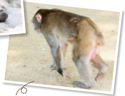
だいぶ腰も曲がってます