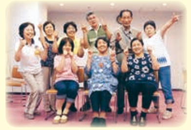
9月 笑いヨガ定例会

また、出張笑いヨガ(有料)も好評で、地区の健康教室や老人会、女性の会などから依頼して頂き、参加の皆さんと大笑いしています。是非、一緒に大笑いしましょう。