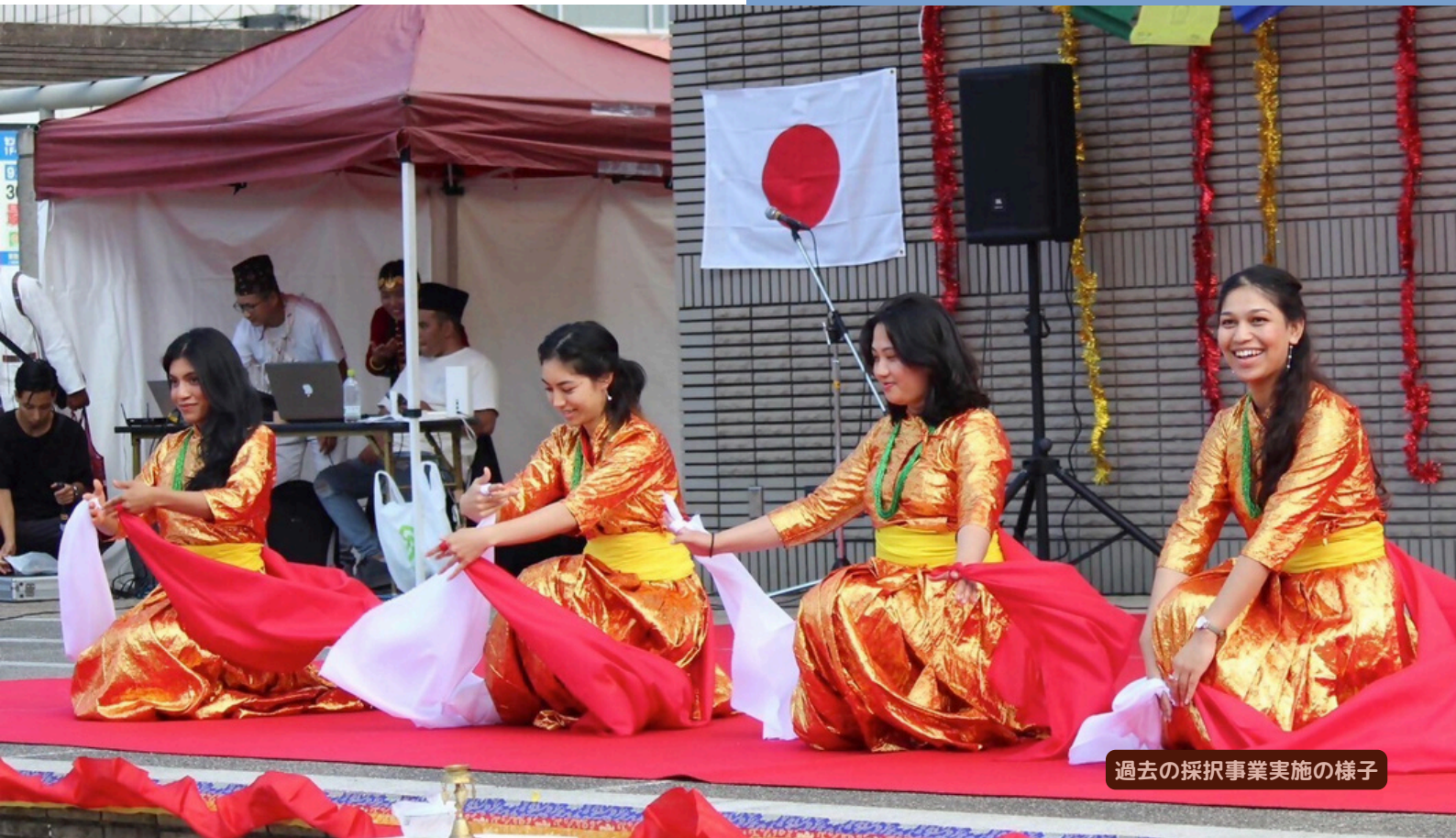
過去の採択事業実施の様子