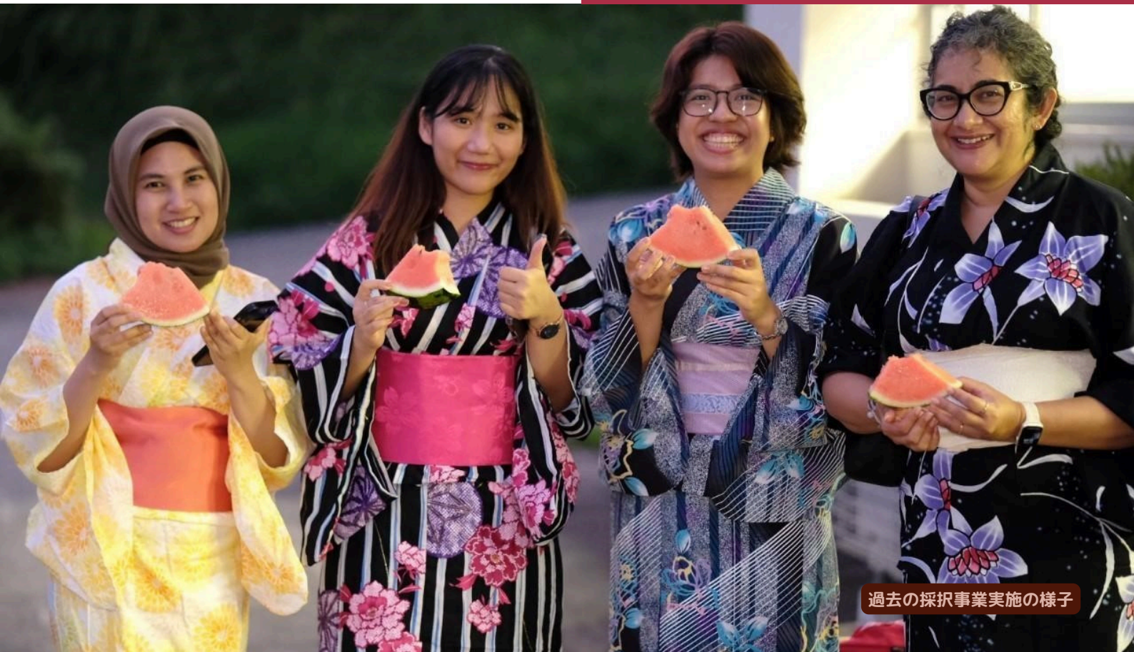
過去の採択事業実施の様子