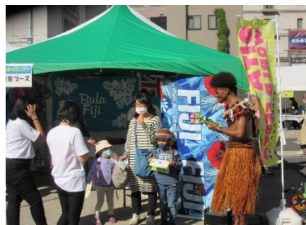
(昨年開催時の様子)