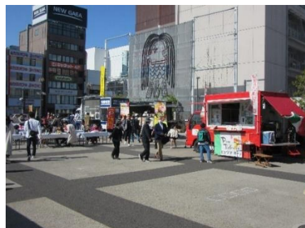
(昨年開催時の様子)