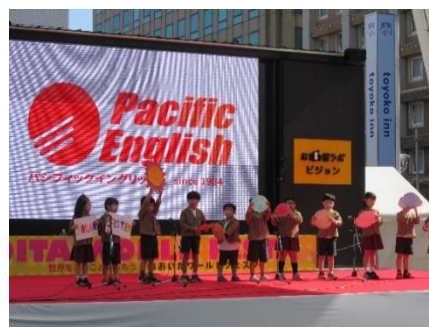
(昨年開催時の様子)