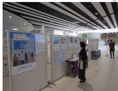
(昨年開催時の様子)