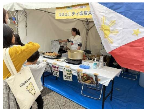
(令和7年度 開催時の様子)