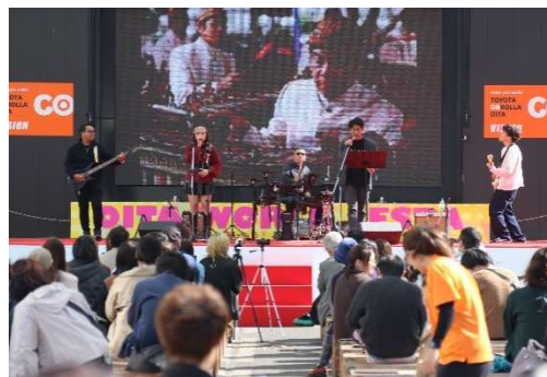
(令和7年度 開催時の様子)