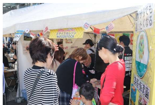
(令和7年度 開催時の様子)