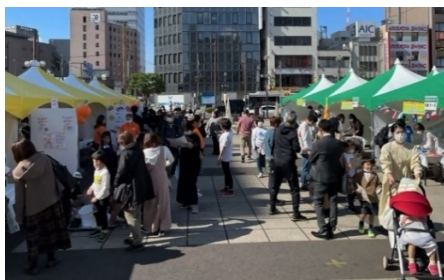
交流・展示・物販ブースの様子