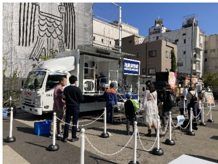
地震体験車の様子①