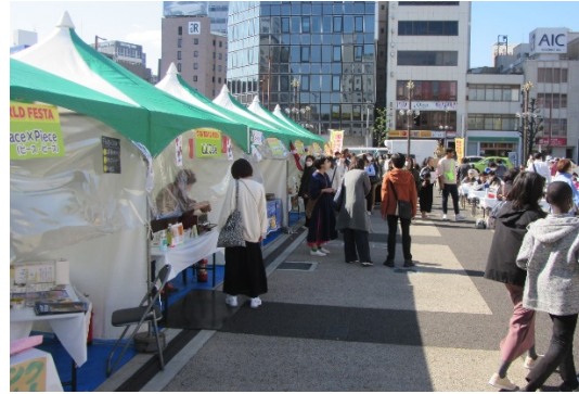
飲食エリアの様子②