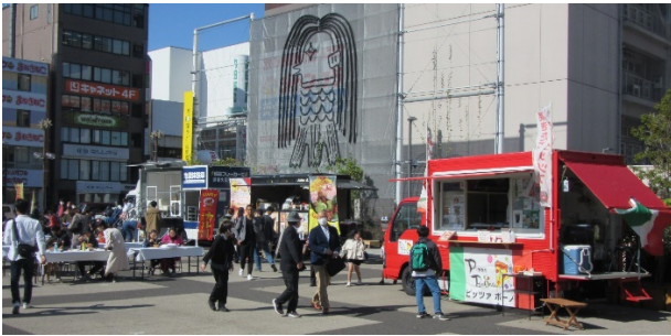
飲食エリアの様子①