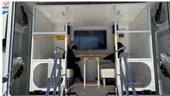
地震体験車の様子②