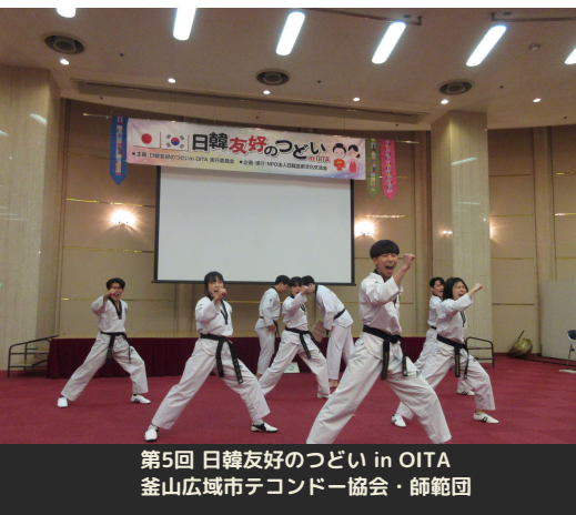
第5回 日韓友好のつどい in OITA 釜山広域市テコンドー協会・師範団