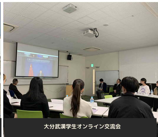
大分武漢学生オンライン交流会