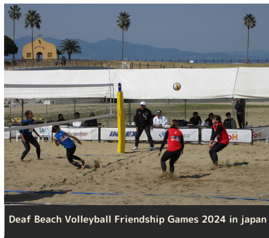
Deaf Beach Volleyball Friendship Games 2024 in japan