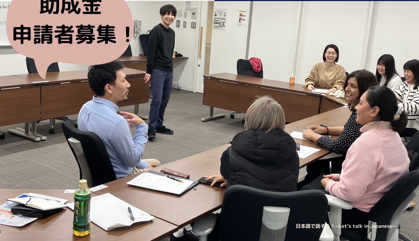
日本語で話そう！～Let's talk in Japanese～