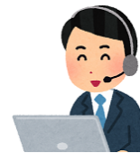
大分市新冠疫苗呼叫中心工作人员