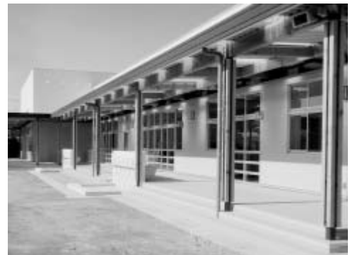
賀来幼稚園園舎（平成23年1月完成）