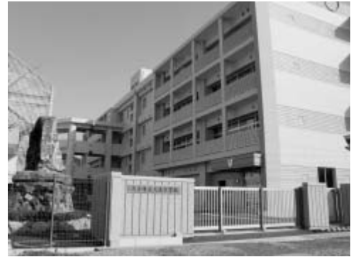
大在中学校南校舎（平成22年12月完成）