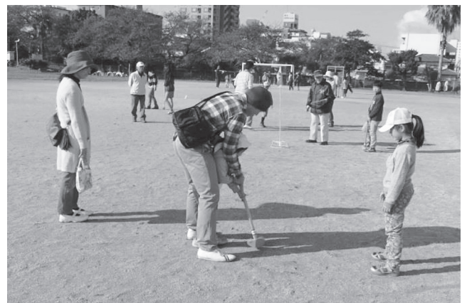
体験・楽習・すこやか講座事業