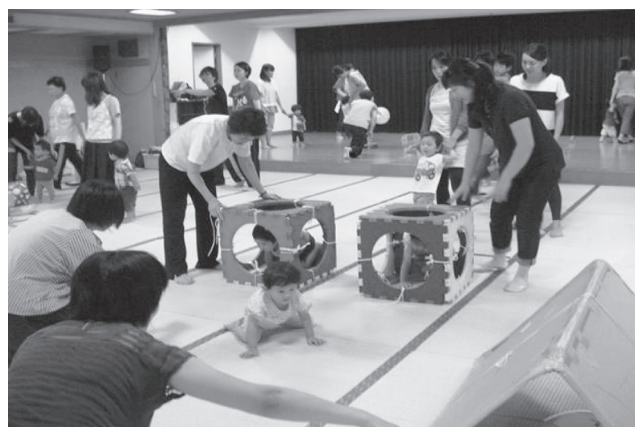
乳幼児家庭教育学級

子育て支援に関する学習を通じて、地域で活躍する子育て支援者のスキルアップを図る。