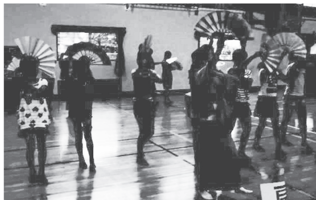
伝統芸能ふれあい教室