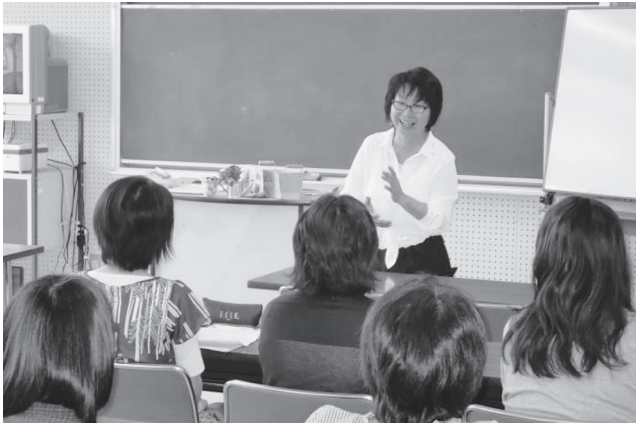
家庭教育学級リーダー研修会