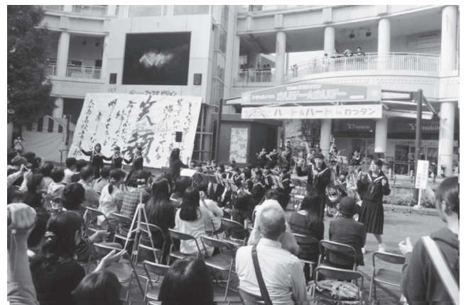
おおいた人権フェスティバル2014