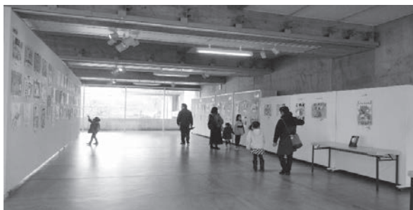
令和3年度学校給食ポスター展会場風景