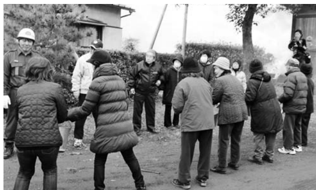
住民によるバケツリレー

平成24年度は、平成25年1月23日（水）に国指定重要文化財「木造大日如来坐像」を所有する金剛宝戒寺で、地元自治会の協力を得て、大分中央消防署と共同で通報訓練、初期消火訓練、放水訓練を行なった。参加者 73名