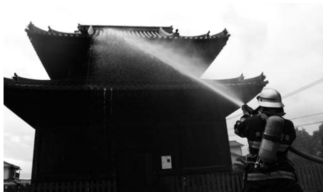
「大日堂」への放水訓練