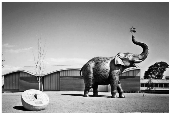
象「遊星散歩（安藤 泉作）」