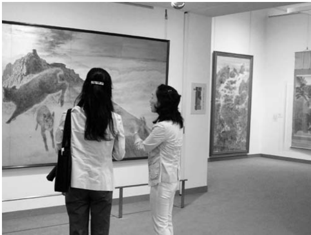
所蔵作品の解説をするボランティア

美術関係資料の収集整理、所蔵作品の解説、ワークショップの実施、その他展覧会諸事業への協力など。