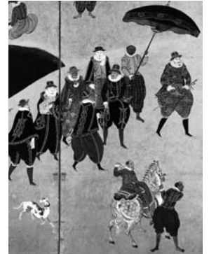
南蛮屏風 部分（模写） 原品：神戸市立博物館

内容 大友宗麟が活躍した時代、豊後府内の町は、堺・博多とならぶ日本を代表する国際貿易都市であり、長崎と同じようにポルトガル船が寄港する港湾都市でもあった。