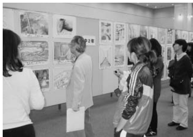
「福田平八郎賞」図画展