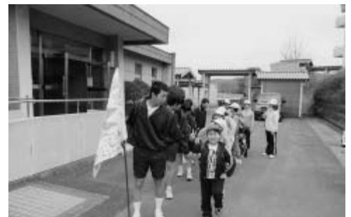
平成23年度 竹中小学校・竹中中学校 合同お見知り遠足