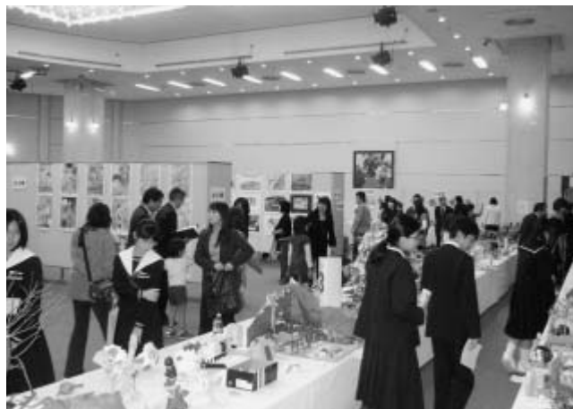
「朝倉文夫賞」彫塑展