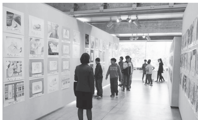
「福田平八郎賞」図画展