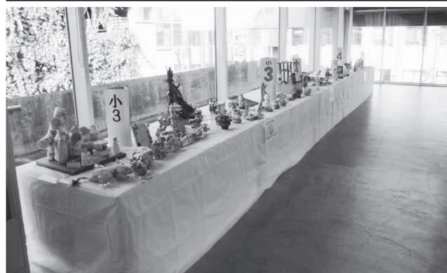
「朝倉文夫賞」彫塑展