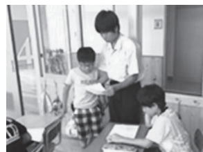
大在中学校区の 里帰りティー チャーの様子