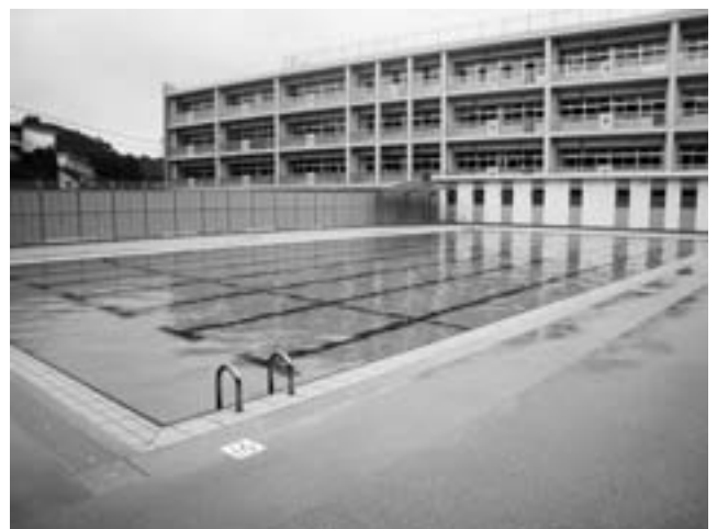
大在中学校プール（平成24年3月完成）