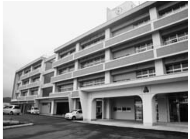
坂ノ市小学校校舎（平成23年12月完成）