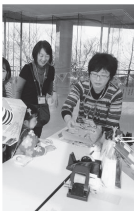
ワークショップを行うボランティア

美術関係資料の収集整理、所蔵作品の解説、ワークショップの実施、その他展覧会諸事業への協力など。