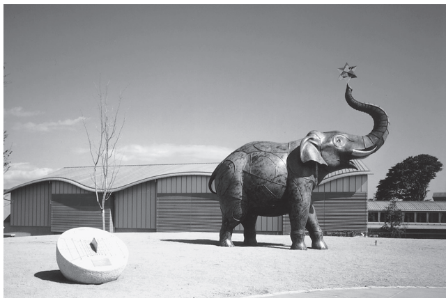
「遊星散歩（安藤 泉作）」