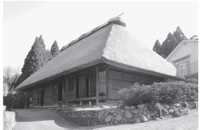
後藤家住宅（保存修理後）