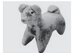
犬形土製品 （中世大友氏館跡）

本展示では、日本各地の遺跡からの出土品や犬に関わる作品・資料等から、犬と人とのつきあいの歴史を紹介する。