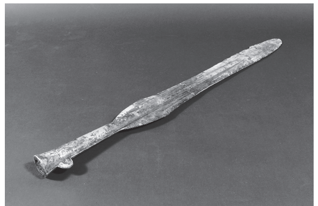
猪野遺跡出土銅矛