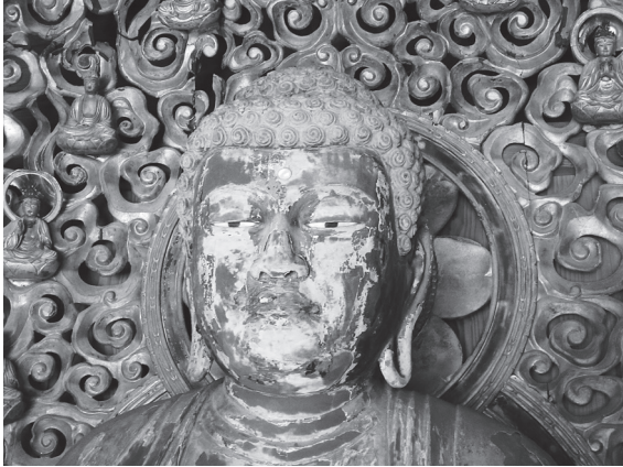
木造釈迦如来坐像