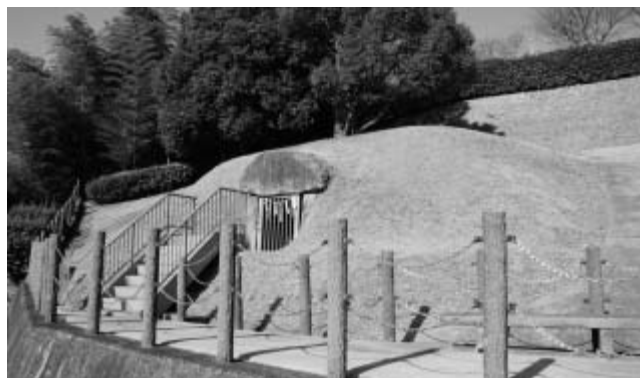
国指定史跡「古宮古墳」

本特別展では、壬申の乱をはじめ律令国家の成立過程にあった飛鳥の宮都や、高松塚古墳をはじめとした古墳時代終末期の古墳などを通して、国指定史跡「古宮古墳」の意義について紹介する。