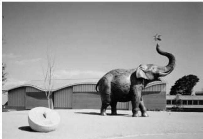
象「遊星散歩 (安藤 泉作)」