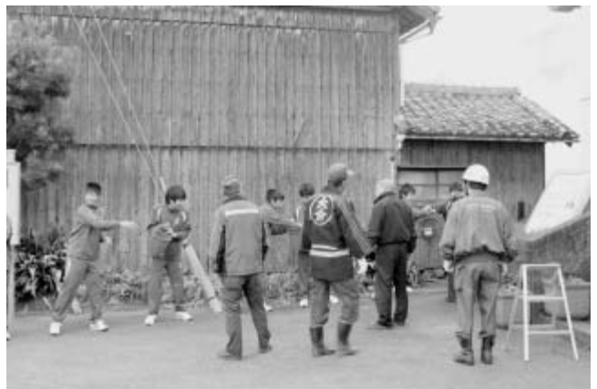
文化財防火訓練「毛利空桑記念館」

平成22年度は、1月26日に県指定史跡「毛利空桑記念館」で、地元自治会の協力を得て、大分東消防署と共同で通報訓練、初期消火訓練、放水訓練を行なった。参加者169名