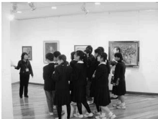
所蔵作品の解説をするボランティア

美術関係資料の収集整理、所蔵作品の解説、ワークショップの実施、その他展覧会諸事業への協力など。