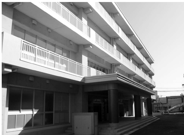
春日町小学校北校舎