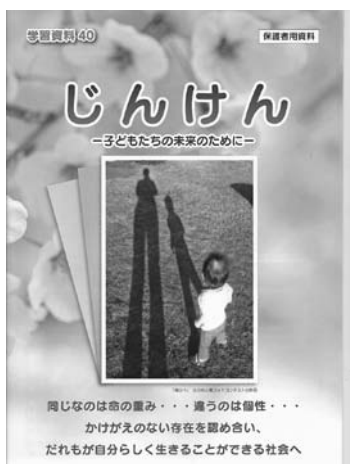
学習資料「じんけん」