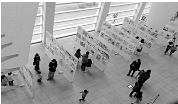
令和4年度学校給食ポスター展会場風景