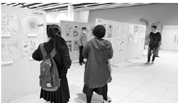
平成29年度学校給食ポスター展会場風景

児童生徒の保護者を対象に学校給食試食会を開催し、学校給食への理解を図るとともに、学校と家庭との連携を深めることを目的として、各学校毎に実施している。