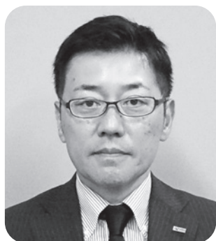
古城 一 委員