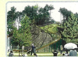
スライダー 全長60メートルの ジャンボスライダー。