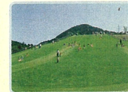
草すべり広場 広々とした芝生で、おもいっきり 草スキーを楽しもう。