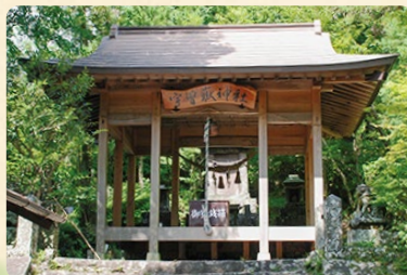
宇曾嶽神社／「子供の虫封じ」と「気力・根性」の神。