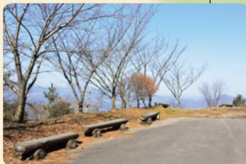
頂上付近駐車場ベンチ