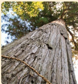
樹齢400年と言われる五柱神社の御神木の杉。高さ28m、幹周4.1m。

五柱神社／明治時代から継承されている深山流伊与床神楽は大分市指定無形民俗文化財。