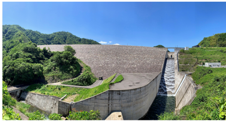
NOTSUHARU OITA NANASE DAM