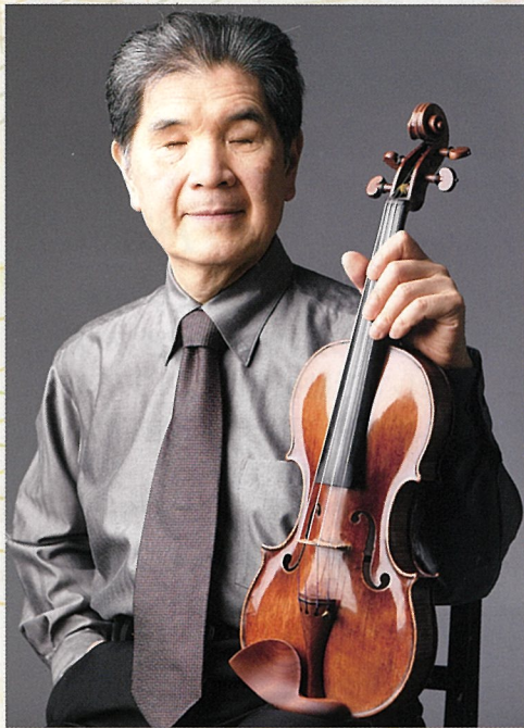
わ な み た か よ し ヴァイオリン 和波孝禧