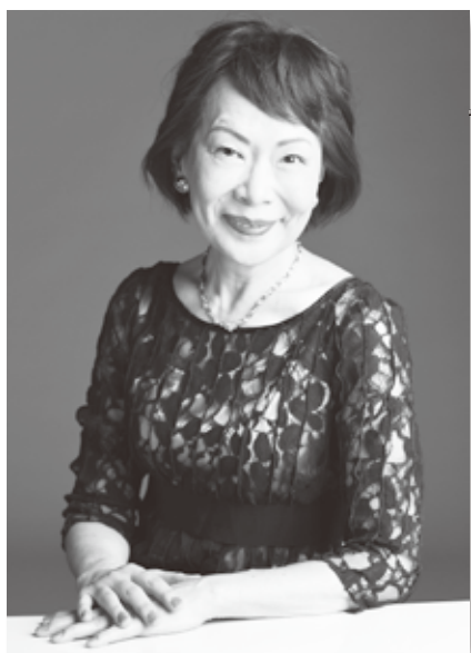
ピアノ つち や み ね こ 土屋美寧子

1945年生まれ。4才でヴァイオリンを始め、17才で日本音楽コンクール優勝。その後パリとロンドンでの国際コンクールにも上位入賞し、50年余りにわたりソリストとして国内およびアジア、ヨーロッパ、アメリカ、中東など各地でオーケストラとの協演やリサイタルに活躍。ピアニスト土屋美寧子とのデュオ、東京での「クリスマス・バッハシリーズ」や「アフタヌーン・コンサート」の開催、サイトウ・キネン・オーケストラへの参加など、多彩な活動を続け、多くのCDをリリース。また桐朋学園と、自ら主宰する「八ヶ岳サマーコース&コンサート」で後進の指導に当たっている。文化庁芸術祭優秀賞、紫綬褒章、旭日小綬章、サントリー音楽賞など受賞多数。