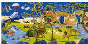
アゴロンとダフネ (2007)