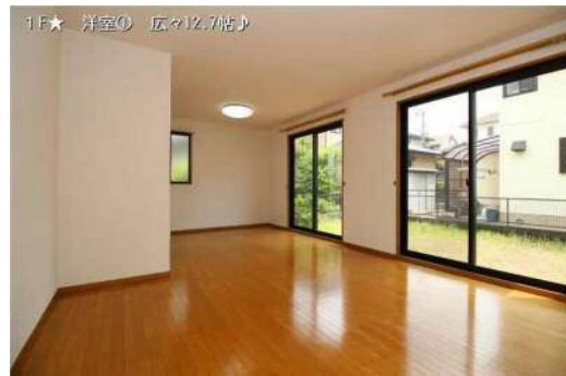
1F★ 洋室0 広々12.7帖♪