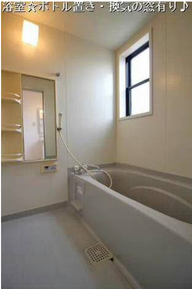
浴室☆ホトル置き・換気の窓有リ♪