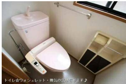
トイレ☆ウォシュレット・換気の窓が有ります♪