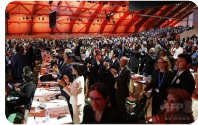
世界が喝采！ パリ協定

「地球温暖化(以下、温暖化)」のABCを学びませんか。温暖化の脅威は刻々と迫っています。「温暖化の現在と未来」「世界と日本の動向」等、リアルな学びをしながら、八丁原地熱発電所見学、「不都合な真実II」の映画鑑賞、祖母・傾き・大崩エコパークの受講などを盛った気楽な「温暖化入門講座」です。