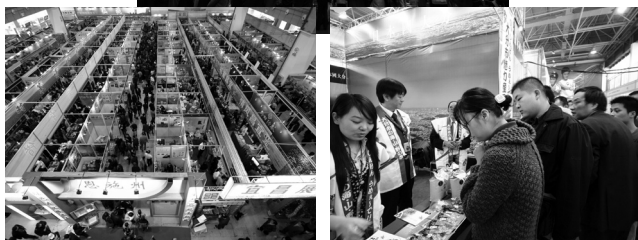
昨年度のブース出展