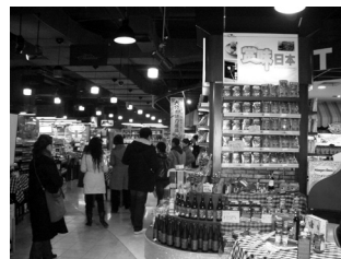
昨年度の現地スーパーでのイベント

経済ミッションは9月中旬に募集を開始します。詳しい内容は大分市産業振興課まで直接お問合せ下さい。