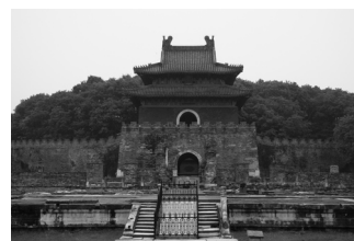
赤壁古戦場の城壁

や周瑜の兜を形取ったユニークな形の「赤壁大戦陳列館」、諸葛孔明を記念する「武侯宮」、孔明が神風を呼んだとされる「拜風台」、周瑜とともに活躍した龐統を記念する「鳳雛庵」など、赤壁の戦いに関係のある観光ポイント満載のコースです。