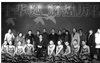
過去の記念式典の様子

1979年9月、武漢市と大分市は新日鉄の武漢鉄鋼への技術指導をきっかけに、友好都市関係を結びました。これまで様々な分野において、市民、行政レベルでの交流を行い成果をあげてきました。