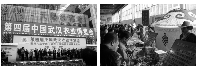
昨年の農業博覧会開幕式