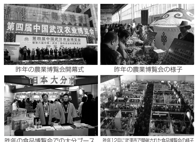
昨年の農業博覧会開幕式 昨年の農業博覧会の様子 昨年の食品博覧会での大分ブース 昨年12月に武漢市で開催された食品博覧会の様子