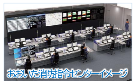
おおいた消防指令センターイメージ

4階 おおいた消防指令センター (10月運用開始予定) 県内全ての119番通報の受け付け、救急車・消防車の出動指令などの 消防指令業務を全県下の消防本部と共同で運用します。