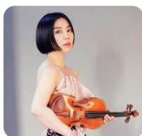
武内麻美(ヴァイオリン)