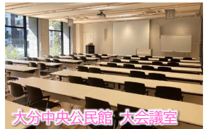
大分中央公民館 大会議室

1・2階 コモンスペース 2階 実技室 開館時間 午前9時～午後9時 展覧会・イベントなどで使用できます。 2階には絵画制作などで使用できる実技室もあります。 予約方法など詳しくは、美術振興課(☎554-5800)へお問い合わせください。