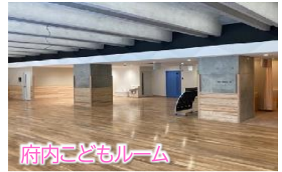
府内こどもルーム

1階 府内こどもルーム 開館時間 午前9時30分～午後5時 旧中島小学校にある府内こどもルームを移転します。 こどもルームは、親子で気軽に来て遊べる場所です。 詳しくは、子育て交流センター(☎576-8740)へお問い合わせください。