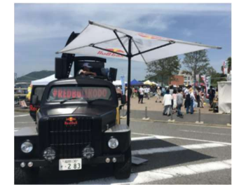
Red Bull Event Car KODO