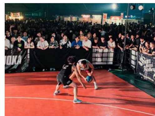
3x3(エキシビジョンマッチ)