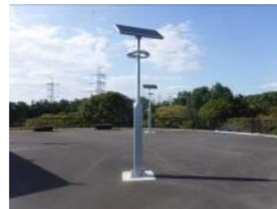
照明施設(3基) ソーラーパネル式を使用