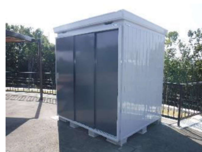
防災倉庫(1基) 簡易トイレ等を収納